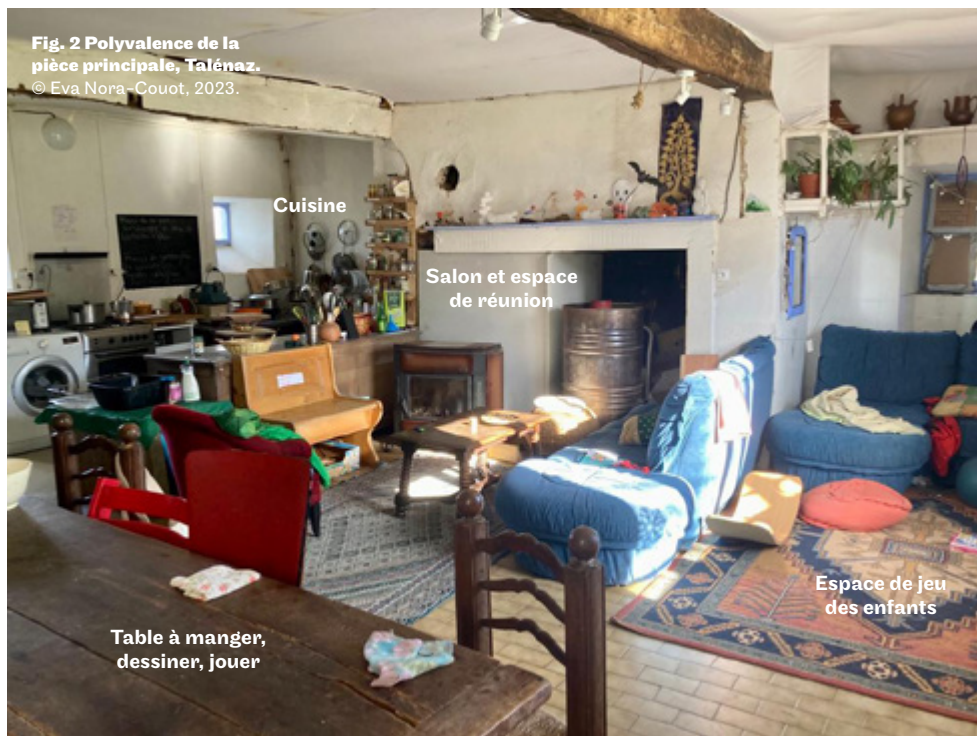
Fig. 2 Polyvalence de la pièce principale, Talénaz.