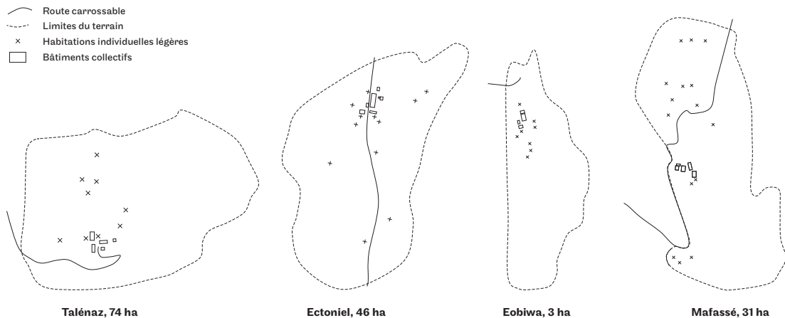
Fig. 1 Schémas de la répartition des constructions sur les terrains d'enquête. © Eva Nora-Couot, 2023.

Les quatre terrains d'enquête ont été sélectionnés pour leur diversité spatiale et leur dynamique collective (Fig. 1) 2 . Il s'agit de :